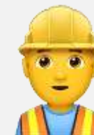
Подрядные организации, третьи лица