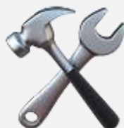
Инструменты и приспособления