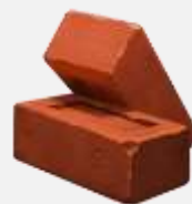
Материалы и сырье