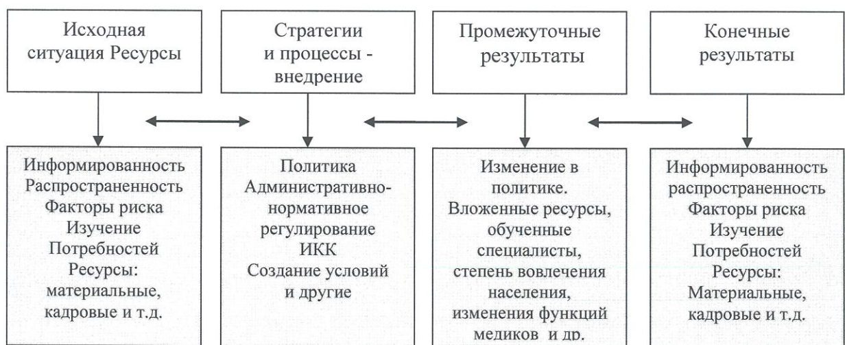
Схема оценки программы

Система показателей оценки эффективности реализации Программы представляет собой алгоритм оценки фактической эффективности в процессе и по итогам реализации Программы, и основана на оценке ее результативности с учетом объема ресурсов, направленных на ее реализацию, не парированных рисков и достигнутых результатов, оказывающих влияние на изменение соответствующей сферы социально-экономического развития Дальнереченского городского округа.