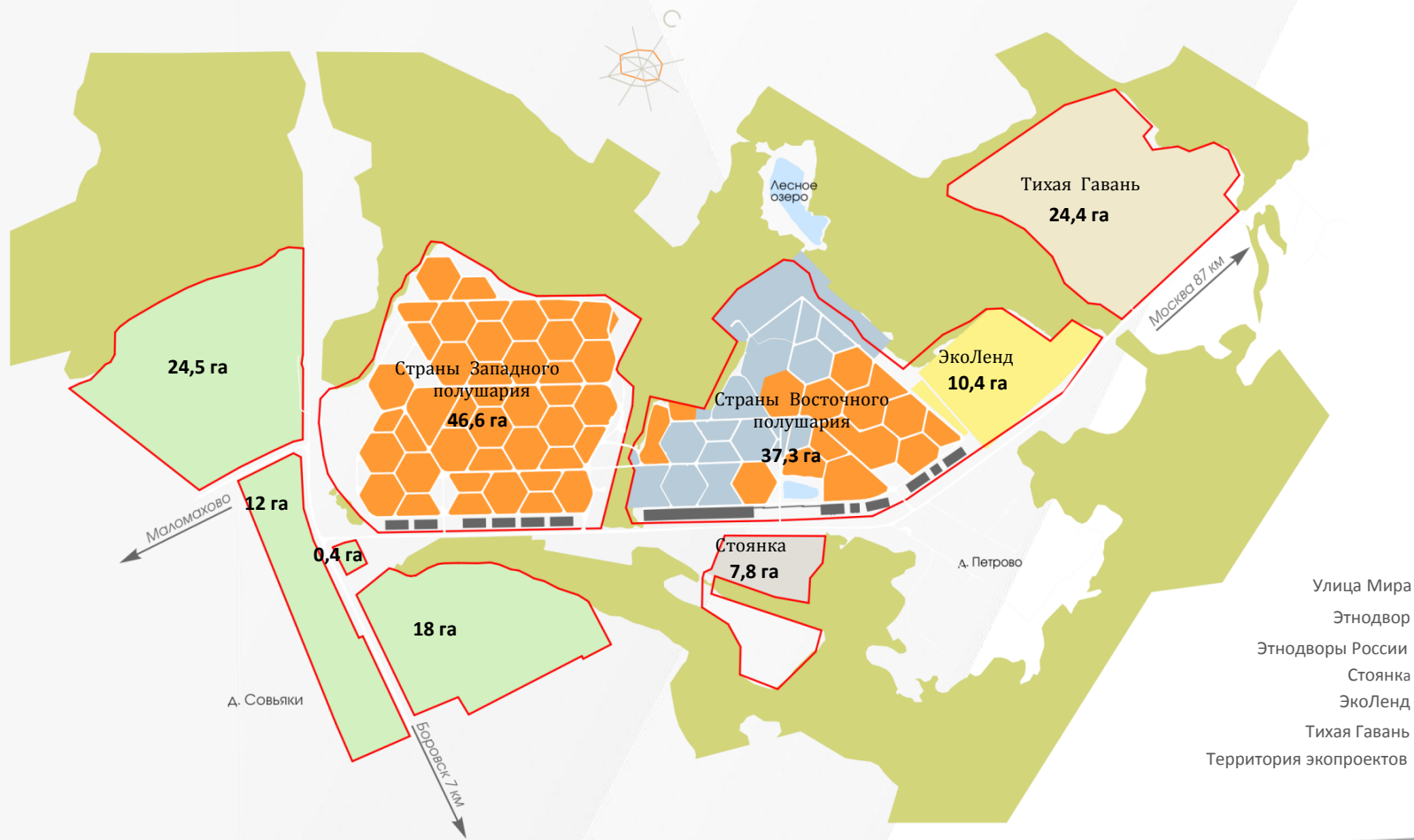
Схема территории ЭТНОМИРА