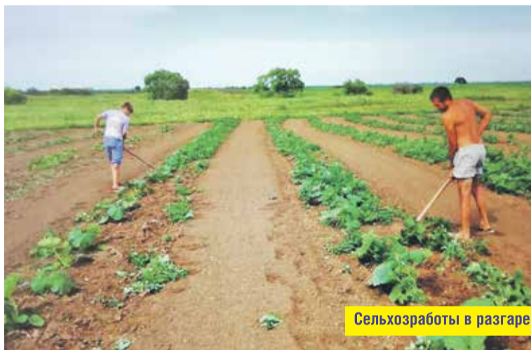
Сельхозработы в разгаре

года инспектор Россельхознадзора зафиксировал, что «участок не огорожен... часть площади заросла сорной травой... собственники участка не заботятся о сохранении почв и их плодородия... о защите от заболачивания... способны негативным (вредным) воздействиям, в результате которых происходит деградация земель...».