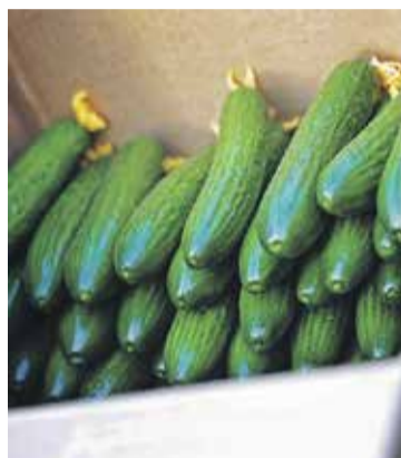
Урожай в суражевских теплицах отменный. Кто продукцию знает «в лицо», никогда не спутает с китайской

На приморском рынке основными конкурентами суражевских овощей, по-прежнему, остаются китайские культуры. Основное преимущество иностранных овощей перед нашими «экологически чистыми» – это цена: китайские огурцы продают за 60-70 руб./кг, а суражевские стоят порядка 110 руб./кг. В планах ФГУП «Дальневосточное», конечно, расширение, для которого требуются федеральные вливания. Вероятно, в будущем модернизированных теплиц станет