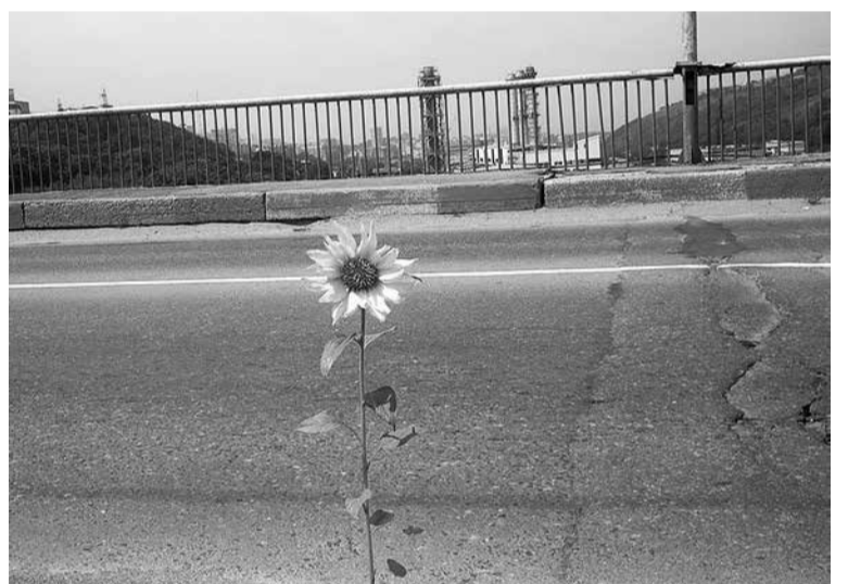
Сельское хозяйство в Приморье вынуждено пробиваться сквозь толщу барьеров и помех

экспорте зернобобовых через порты Приморья позволяют решить комплексную задачу по накоплению судовых партий зерна, его подработке и доставке в морские порты Приморского края. Предприятием отработана и опробована до-