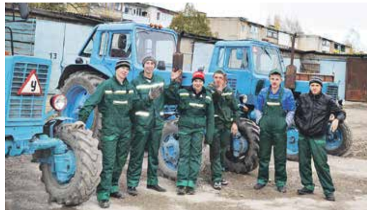
Эксперты по сельскому хозяйству в Приморье выразили общее мнение, что аграрные образовательные учреждения края обладают достаточным потенциалом для обеспечения развития агропромышленного комплекса региона

Нужна программа подготовки кадров на селе. Об этом говорилось еще в декабре 2017 года на совещании по вопросам кадровой политики в агропромышленном комплексе.