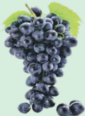
Ягода сладкая, крупная, две кисти, и уже ведро – такого точно в магазине не встретишь

Сорт «Альфа» из Северной Америки. С него началось в 30-е годы прошлого столетия разведение винограда в Приморье. У него мощная корневая система, которая выдерживает бесснежные зимы и лютые морозы.