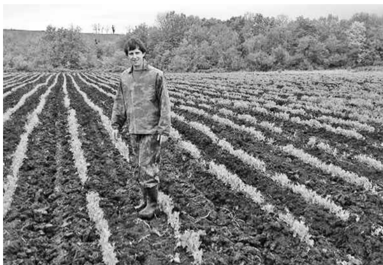
Заказчики все чаще ставят условие фермерам - чтобы продукт выращивался без химии и был сертифицирован

В этом отношении азиатский рынок выглядит более привлекательным для экспорта российской органической продукции, чем европейский и США. Как известно, качество российских продуктов питания высоко ценят в Китае. И не только готовых продуктов. Последние десятилетия на Дальний Восток, прежде всего, в Приморский край и Еврейскую АО, активно шли китайские производители, инвестировавшие в сельхозпроизводство. Одним из главных преимуществ Дальнего Востока в этом отношении является экологическое состояние природных ресурсов, которое высоко оценивается странами с интенсивными агропромышленными технологиями. У нас сейчас многие хозяйства используют химические препараты, те же пестициды, довольно ограниченно из-за их высокой стоимости. Кроме того, мы имеем много не задействованной в производстве земли, а на той, что использует-