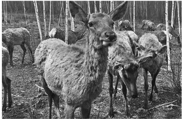
Сейчас на ферме в поселке Лазо содержится 90 маралов

Панты животных обладают целебными свойствами и успешно используются в народной медицине. Из рогов оленей будут изготавливать лекарства, косметику и отвар для целебных ванн.