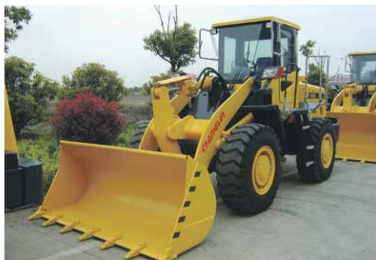
Неожиданно в привилегированной ситуации оказались приморские и дальневосточные клиенты некоторых лизинговых компаний, чьи филиалы зарегистрированы не в Приморье, а в субъектах федерации, где применяется полная льгота по налогу на движимое имущество, в частности, в Московской области. В итоге им удалось избежать налога вплоть до 2020 года

Согласно п. 10 ст. 1 Федерального закона от 30 сентября 2017 № 286-ФЗ налогоплательщики будут вправе применять льготы на движимое имущество, только если они предусмотрены региональным законодательством. 27 субъектов федерации уже приняли подобные законы, позволяющие бизнесу получить льготу в полном объеме либо только определенной категории налогоплательщиков. На