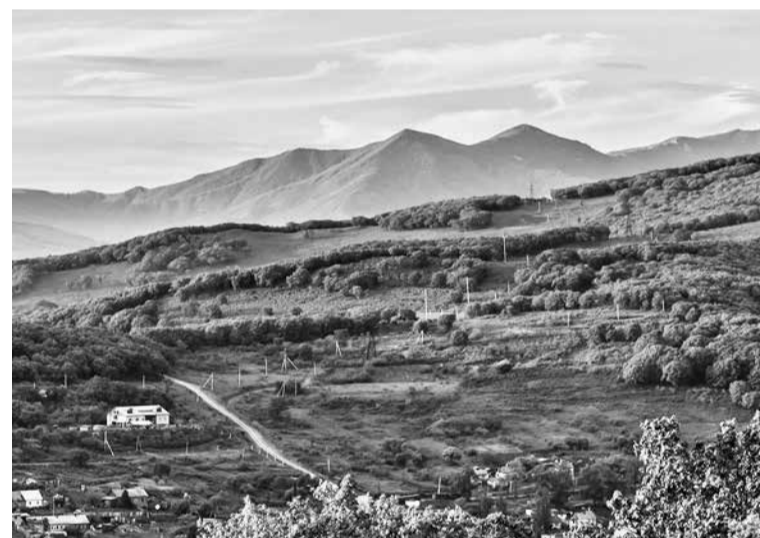
Несмотря на популистские заявления властей, земля в ДВФО до сих пор не стала источником дохода

Елена АБАШЕВА. Газета "Золотой Рог", Владивосток (с сокращениями)