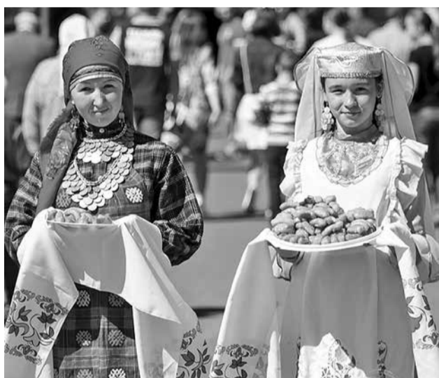
Татарский праздник Сабантуй давно полюбился людям разных национальностей. Но у каждого народа есть свои праздники, особенные. Показ торжеств разных национальностей на одной площадке – великолепная идея, которая привлечет внимание многих приморцев

Размещать гостей предлагаем в небольших домах на 3-6 человек, строительство которых на земельных участках селян (кто захочет участвовать в проекте) можно заранее предусмотреть в планируемом бизнес-плане. Здесь решается еще