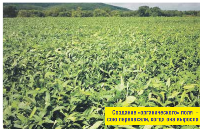
Создание «органического» поля – сою перепалили, когда она выросла