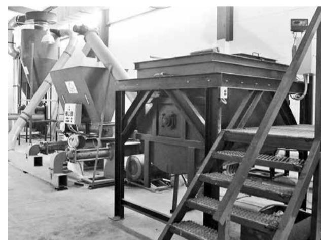
Современные экономические условия и ужесточающееся экологическое законодательство настоятельно требуют внедрения малоотходных и безотходных энергосберегающих технологий

Знаменательно то, что предпринимательская деятельность в селе поддерживается государством вплоть до инвестирования начальных этапов. Высокий уровень безработицы на селе – теоретически большой плюс в подборе будущего коллектива работников. Практически – как повезет. К сожалению, за годы и десятилетия люди в деревне настолько отвыкли от работы на предприятиях, что собрать их порой очень непросто. Смелые предприниматели практикуют вахтовый метод, зазывают на работу граждан стран СНГ – узбеков, украинцев, таджиков, а также рабочих из Северной Кореи и Китая.