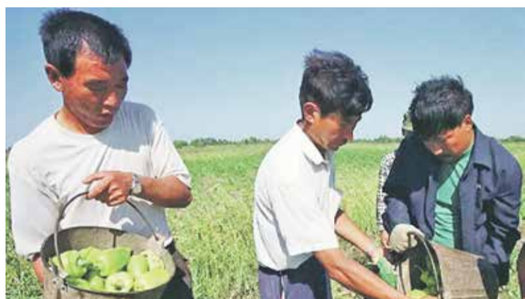
На приморских полях работают узбеки, таджики, китайцы и северные корейцы. В сельском хозяйстве Приморья, по данным Ассоциации корейских организаций, трудятся сегодня около 1000 северных корейцев. Но приморцев на полях и фермах все меньше и меньше...

В Приморье проблема классически решается за счет приезжих, в основном, выходцев из стран ближнего зарубежья. На приморских полях работают узбеки, таджики, китайцы и северные корейцы. Кстати, последние в ближайшем будущем, скорее всего, уедут домой. В сельском хозяйстве Приморья, по данным Ассоциации корейских организаций, трудятся сегодня около 1000 северных корейцев.