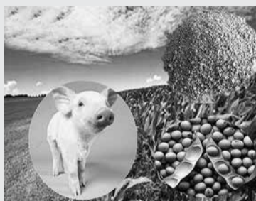
Биотехнология животных включает в себя работу с различными животными (домашней птицей, рыбой, насекомыми, домашними животными) и исследовательскими приемами - геномикой, генной инженерией и клонированием