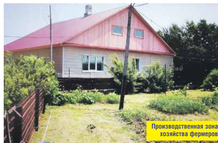
Производственная зона хозяйства фермеров

В результате осмотра владельца земель был вызван для составления протокола об административном правонарушении. Далее запланирована внеплановая выездная про-